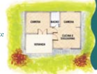
Chalet de Luxe